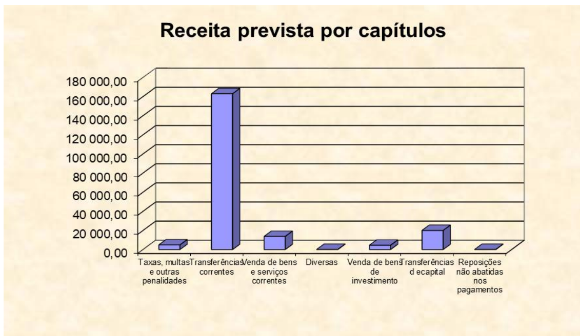
Gráfico n.º 1- receita prevista por capítulos