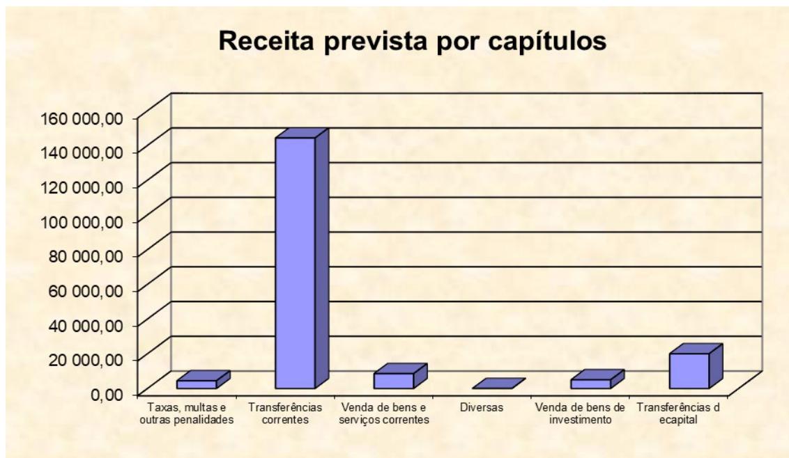
Gráfico n.º 1- receita prevista por capítulos